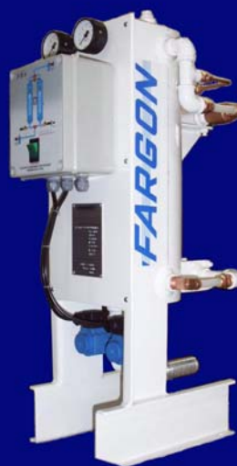
Modelos FDA 0120 / FDA 0130