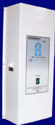
Modelos FDA 0010 a FDA 0020