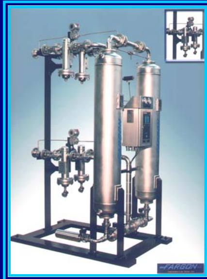
SECADOR AR COMPRIMIDO EXECUÇÃO TOTALMENTE EM AÇO INOX 304/316