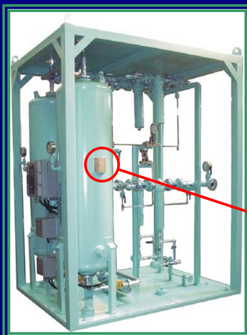
SECADOR AR COMPRIMIDO EXECUÇÃO VASOS DE PRESSÃO COM SELO ASME