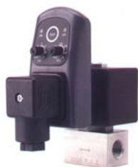
Dreno eletrônico temporizado 400 bar (opcional)

carcaça em aço inox 304/316 ligação corpo/cabeçote rosca vedação por anel o-ring